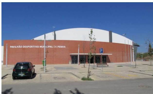
Pavilhão Desportivo Municipal da Penha Avenida Cidade Hayward, 8000-074, Faro